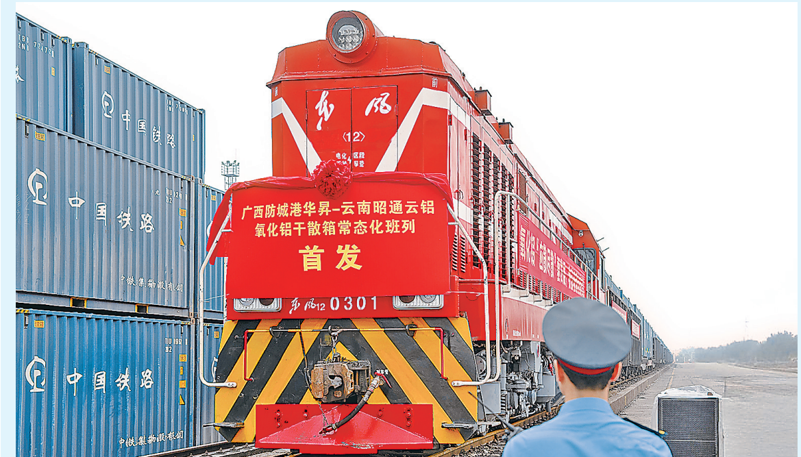
▲图为“广西防城港—云南昭通”氧化铝干散集装箱班列首发现场。

本报讯 近日,“广西防城港—云南昭通”氧化铝干散集装箱班列成功首发。 该班列是中铝物流东南亚陆港深入落实中铝集团“散改集”战略、推动铝产业链绿色高效发展的重要举措。通过优化散货装车组织、铁路