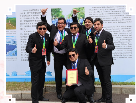
图为作者(左二)与同事在“中国铜业杯”海外企业属地班组长综合管理技能竞赛现场合影。

后来我才知道,这在中国叫“日常”。从那以后,我也沦为了“外卖控”,点咖啡、买水果,手机下单,半小时送上门。我在秘鲁习惯了开车去超市、排队结账、再大包小包拎回家,到了中国才发现,原来生活可以这么“懒”而且舒服。最让我开眼界的,还是坐高铁去洛阳比赛。中国人进站不用纸质票,不看身份证,手机刷一下二维码就过去了。列车加速的时候,我盯着车厢显示屏上的数字往上跳:250、280、305……高铁