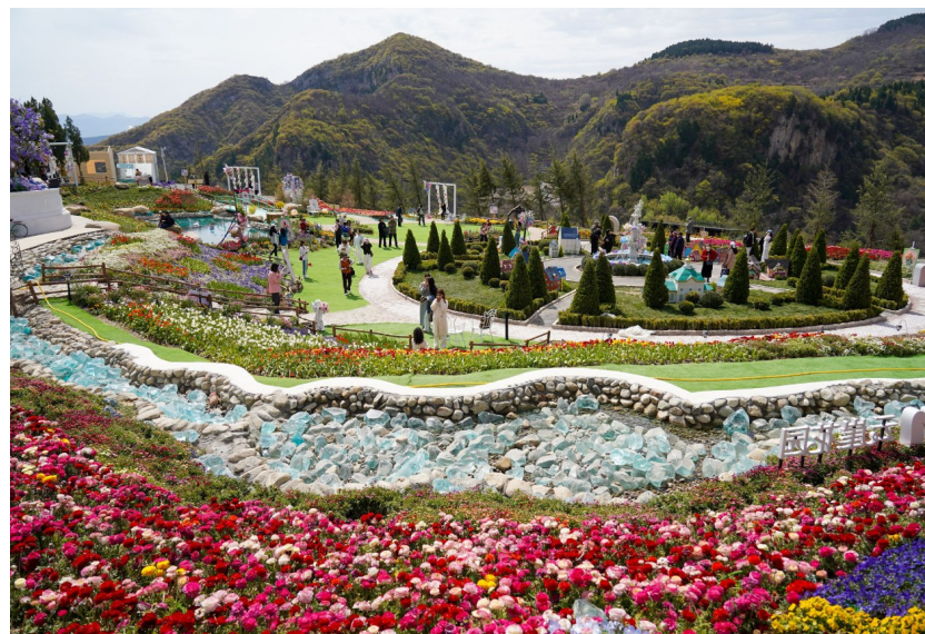
图为游客在山东淄博红叶柿岩旅游区云崖花园内游览。

国家发展改革委国家信息中心大数据发展部副研究员邢玉冠表示,一季度,我国线下消费呈现总量稳健、结构优化的良好开局,特别是家电、数码产品等消费需求旺盛,这是超长期特别国债支持消费品以旧换新、优化个人消费贷款贴息