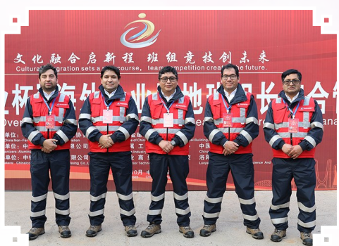
图为作者(中)与同事在“中国铜业杯”海外企业属地班组长综合管理技能竞赛现场合影。

赛前,我最担心的不是比赛,而是语言。在山东商务职业学院,第一堂中文课就把我“整不会了”。老师教我们数数,我的舌头像打了结。旁边几内亚的哥们儿念得比我顺溜,我急得满头汗。