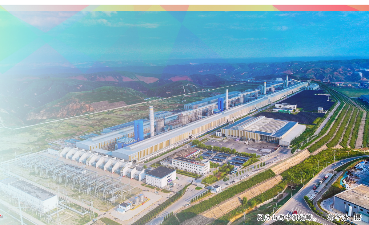
图为山西中润俯瞰。