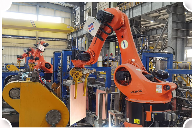
图为滇中有色机械臂工作场景。

目常态化运行，滇中有色建立正向激励机制，将项目节点与成果量化，与绩效挂钩，激发员工内生动力。从供销寻源、技术攻关到稳定运行，各环节价值创造潜力得到充分激发。截至目前，滇中有色累计处理硫磺渣和硫磺渣量已突破预期目标，通过优化配比和工艺控制，成功多产出硫酸7000余吨，创效约600万元。