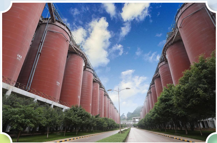
图为广西华银铝业生产区域。

如今，“能修必修、变废为宝”已成为广西华银铝业全员的行动自觉，修旧利废不仅降了成本，更锤炼了作风，凝聚了合力，为企业高质量发展注入绿色新动能。