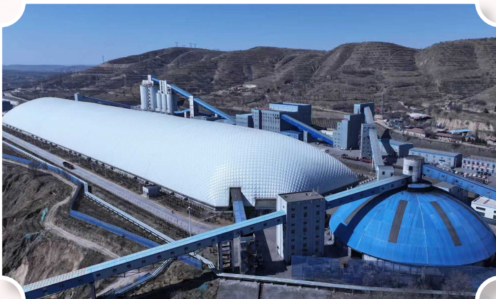
图为王洼煤业王洼选煤厂。

开年以来，王洼煤业紧扣“安全、合规、绿色、发展”战略方向，以“六大体系”高效运行为抓手，安全底板越筑越牢，高效稳产势头强劲，智能升级全面提速，项目建设火力全开，党建引领聚力赋能，交出了一份成色足、亮点多、势头好的“硬核答卷”：一季度，原煤产量超额完成进度计划，销售收入取得新突破，实现产量与效益“双丰收”，为实现全年目标打下坚实基础。