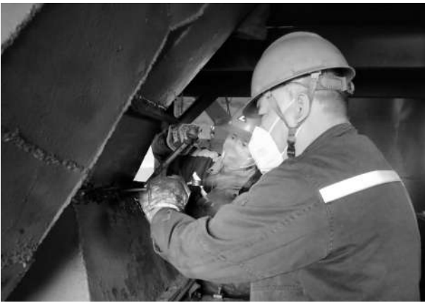
3月份以来，炭素事业部成型一车间对现场存在的油、气、风、料等泄漏点进行集中治理，先后制作料管缓冲料盒6个，法兰盖板结合面加垫密封14处，收尘管磨损沙眼密封胶22处，设备泄漏状况得到明显改善。图为员工在对下料管法兰间隙紧固密封。