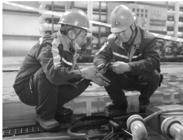
为降低工业新水消耗，节约检修费用，近期，热电厂燃化工区重点整治了水处理超滤系统7号超滤漏点。7号超滤共有88个滤芯，由于密封老化，漏水严重，燃化工区对这一问题展开攻关，此项检修预计持续20天左右，7号超滤漏点完全处理好后，月可节约工业水20余吨。

转眼间过去了3个小时，同事们开始进行各项分析工作，我也该回家了，虽然很累，但及时排除了设备故障，心里还是很高兴。